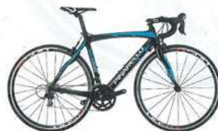
Pinarello FP Team 2775 € Cadre: mono-coque carbone - Transmission: Shimano 105 - Roues: Most Wildcat - Poids: 8,9 kg