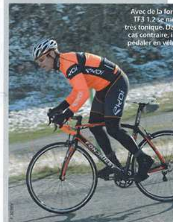
Avec de la force le TF3 1.2 se montre très tonique. Dans ce cas contraire, le pédalier en vélo...