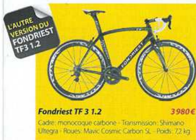
Fondriest TF3 1.2 3980 € Cadre: mono-coque carbone - Transmission: Shimano Ultegra - Roues: Mavic Cosmic Carbon SL - Poids: 7,2 kg