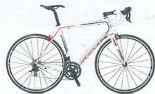
Colnago Ace 2499 € Cadre: mono-coque carbone - Transmission: Shimano 105 - Roues: Shimano R 500 - Poids: 7,8 kg

Un beau vélo italien ne réclame pas forcément une dépense conséquente. Noms prestigieux, esthétique hors du commun et part de légende sont au programme.