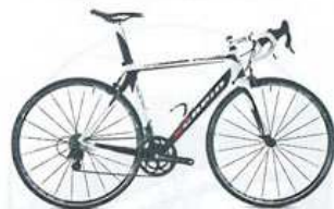
Scapin Blake 2599 € Cadre: mono-coque carbone - Transmission: Campagnolo Athena - Roues: Mavic Aksium - Poids: 7,5 kg